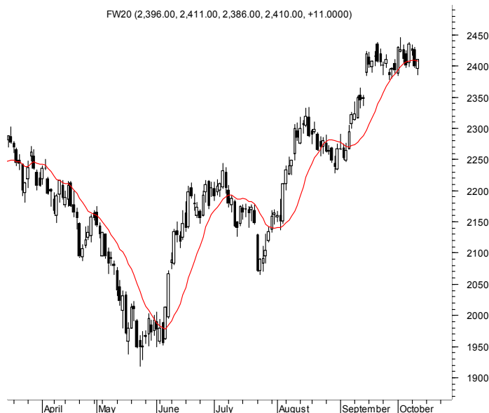
FW20 (2,396.00, 2,411.00, 2,386.00, 2,410.00, +11.0000)

Najbliższe poziomy wsparcia: 2378 2350 2290 2228