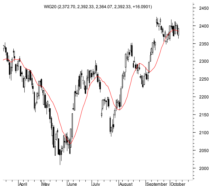
WIG20 (2,372.70, 2,392.33, 2,364.07, 2,392.33, +16.0901)