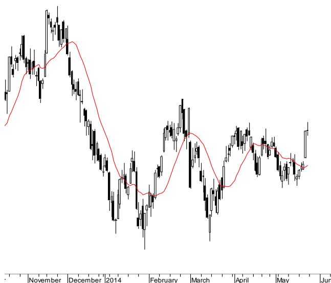
WIG20 (2,469.05, 2,482.55, 2,458.67, 2,465.52, +1.09009)