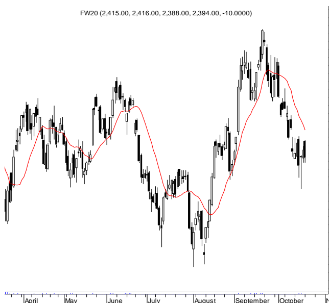
FW20 (2,415.00, 2,416.00, 2,388.00, 2,394.00, -10.0000)