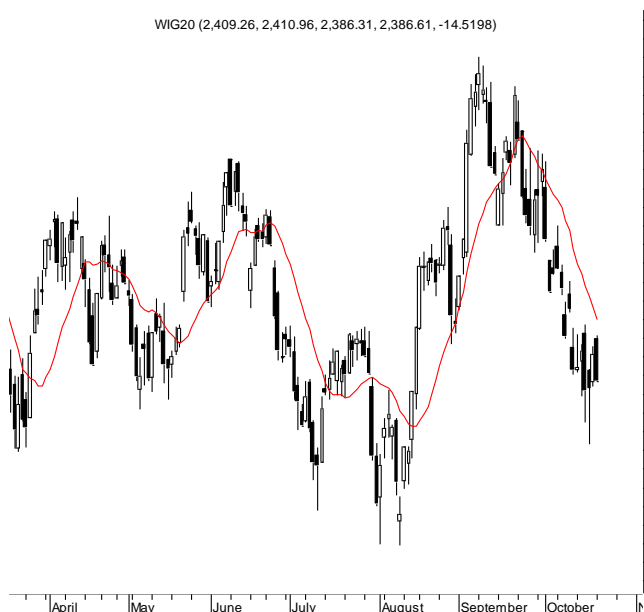
WIG20 (2,409.26, 2,410.96, 2,386.31, 2,386.61, -14.5198)