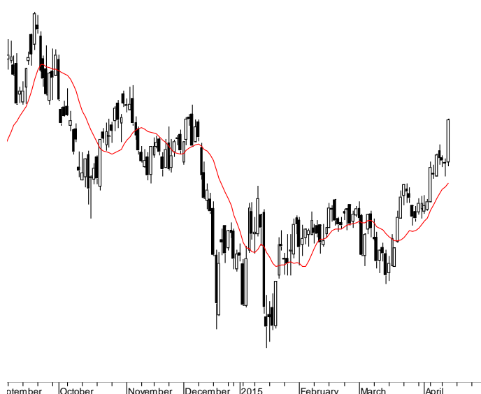
WIG20 (2,432.55, 2,475.59, 2,432.55, 2,475.33, +40.4402)