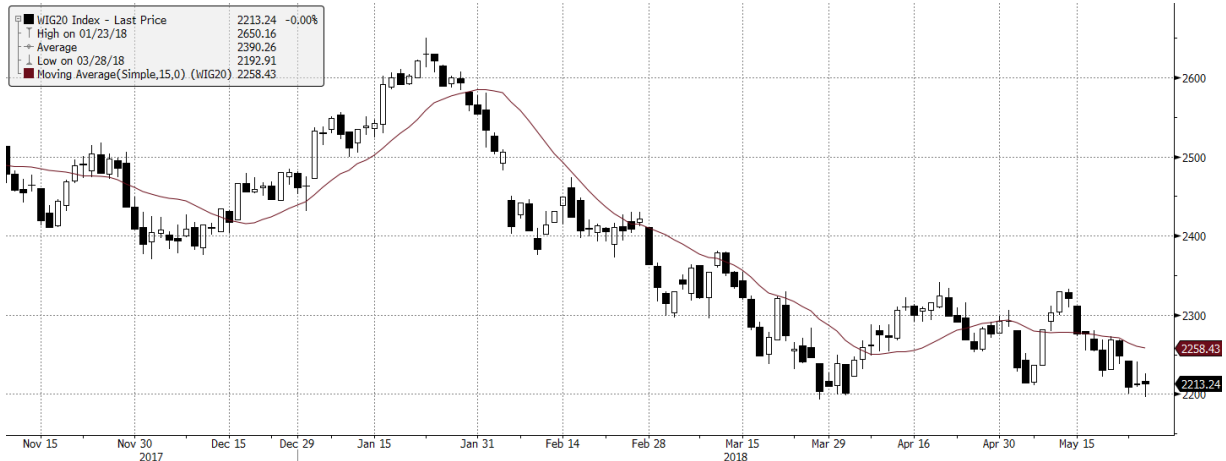
WIG20 Index (WIG20) G1598 Daily 09NOV2017-28MAY2018