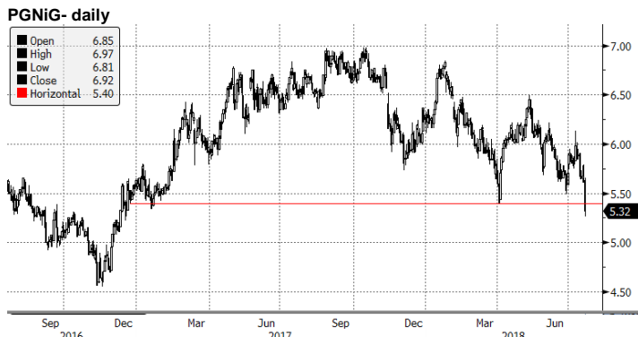
PGN PW Equity (Polskie Gornictwo Naftowe i Gazownictwo SA) Daily 24JUL2016-23JU Copyright© 2018 Bloomberg Finance L.P., 23-Jul-2018 08:15:59 Źródło: Dom Maklerski BDM S.A., Bloomberg

Decyzja WZA o niewypłacaniu dywidendy spowodowała kurs PGNiG do poziomu najniższego od grudnia 2016 roku.