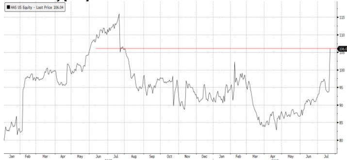
WIG US Equity (Hasbro Inc) Graph 1Y65 Daily v11ANK2017-24334.2018 Copyright 2018 Bloomberg Finance L.P. 24-Jul-2018 07:43:58

Źródło: Dom Maklerski BDM S.A., Bloomberg