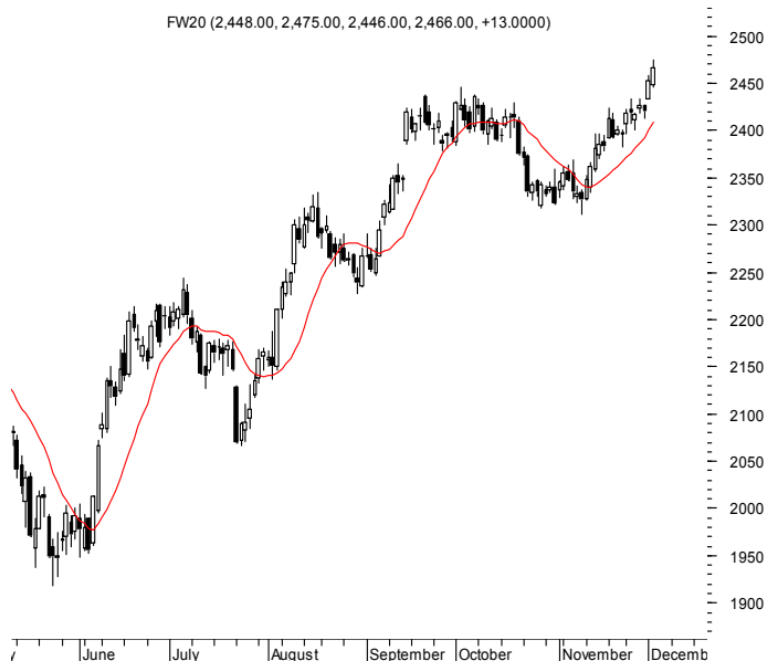
FW20 (2,448.00, 2,475.00, 2,446.00, 2,466.00, +13.0000)

Najbliższe poziomy wsparcia: 2400 2360 2311 2300