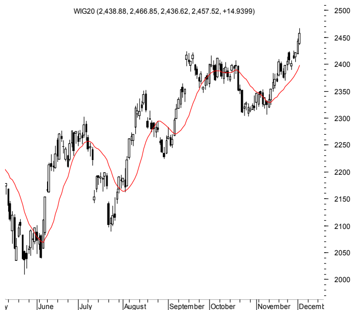
WIG20 (2,438.88, 2,466.85, 2,436.62, 2,457.52, +14.9399)