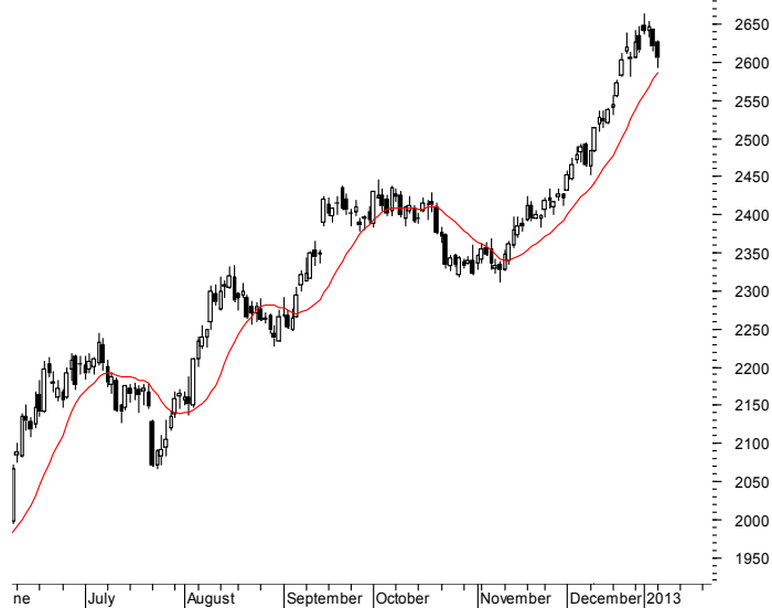
FW20 (2.627.00, 2.628.00, 2.594.00, 2.605.00, -15.0000)

Najbliższe poziomy wsparcia: 2540 2520 2500 2450