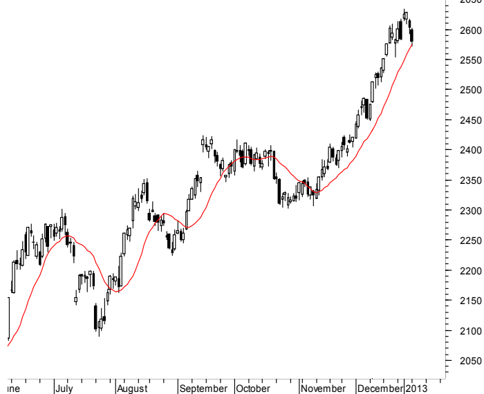
WIG20 (2.600.21, 2.602.15, 2.572.42, 2.578.48, -23.2500)