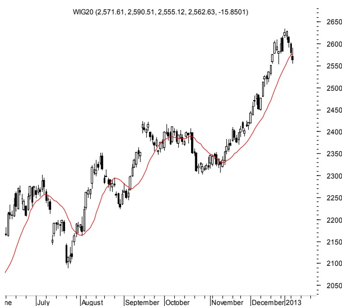
WIG20 (2,571.61, 2,590.51, 2,555.12, 2,562.63, -15.8501)