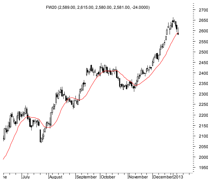
FW20 (2,589.00, 2,615.00, 2,580.00, 2,581.00, -24.0000)

Najbliższe poziomy wsparcia: 2540 2520 2500 2450