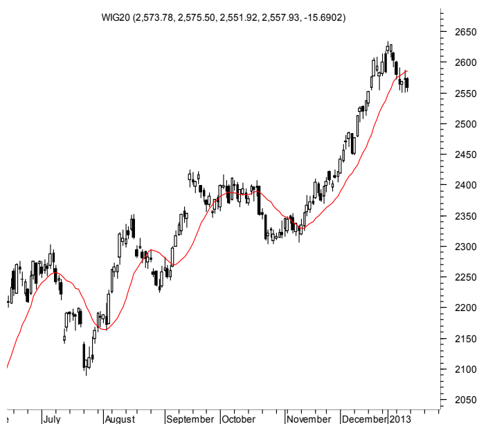
WIG20 (2,573.78, 2,575.50, 2,551.92, 2,557.93, -15.6902)