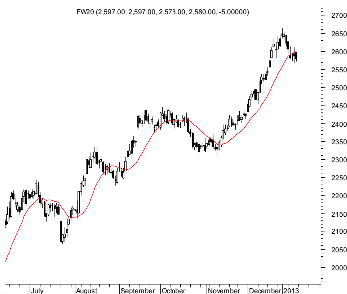
FW20 (2,597.00, 2,597.00, 2,573.00, 2,580.00, -5.00000)

Najbliższe poziomy wsparcia: 2540 2520 2500 2450