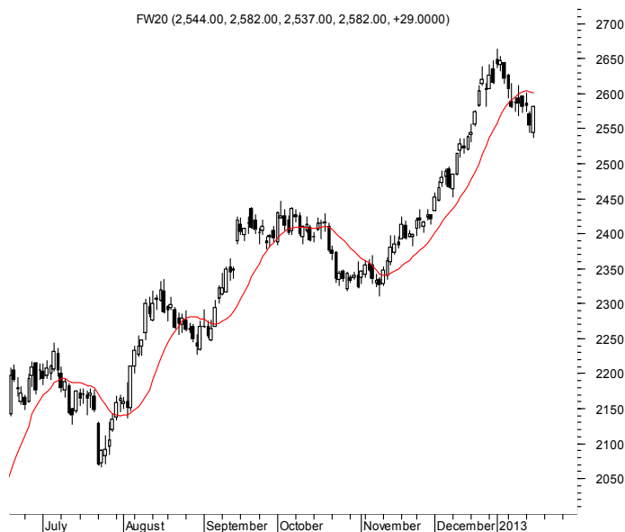
FW20 (2,544.00, 2,582.00, 2,537.00, 2,582.00, +29.0000)

Najbliższe poziomy wsparcia: 2540 2520 2500 2450