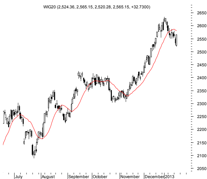
WIG20 (2,524.36, 2,565.15, 2,520.28, 2,565.15, +32.7300)