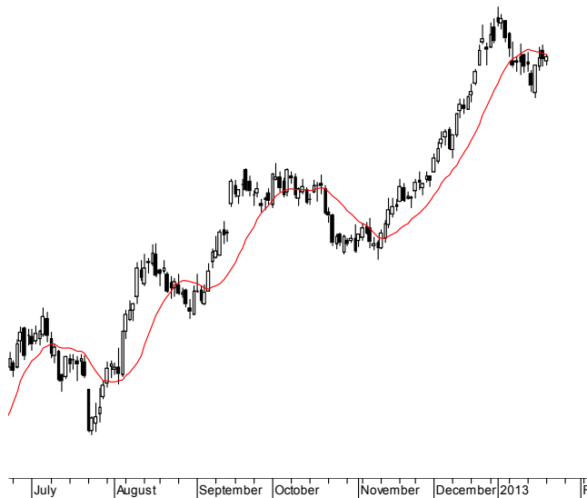
WIG20 (2,570.44, 2,578.18, 2,564.17, 2,573.67, +1.53003)