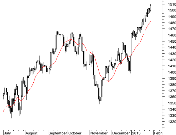
SP500 (1,500.18, 1,509.35, 1,498.09, 1,507.84, +7.65991)