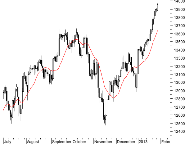
DJIA (13,881.93, 13,969.99, 13,880.01, 13,954.42, +72.4902)