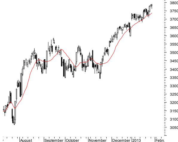
CAC40 (3,780.15, 3,789.92, 3,762.85, 3,785.82, +4.93018)