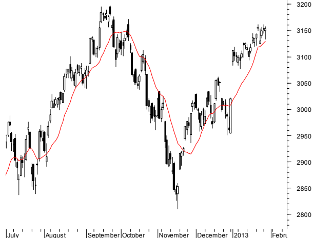
NASDAQ (3,149.62, 3,156.94, 3,133.11, 3,153.66, -0.64014)