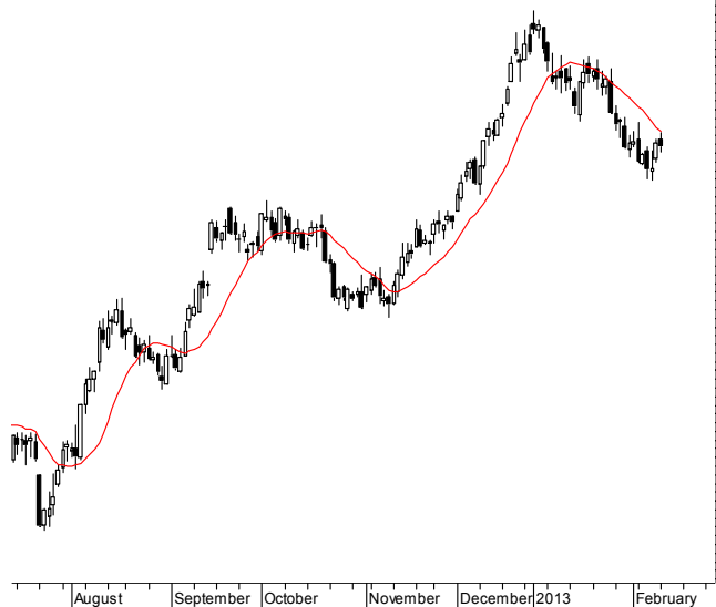
WIG20 (2,501.76, 2,508.47, 2,489.69, 2,497.88, +2.45996)