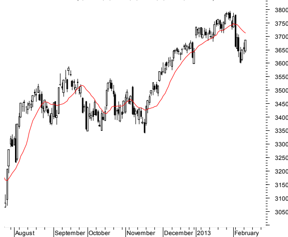
CAC40 (3,645.63, 3,686.58, 3,639.53, 3,686.58, +36.0000)