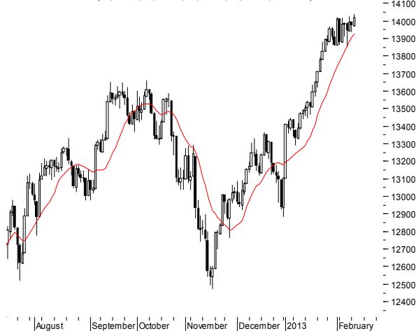
DJIA (13,971.24, 14,038.97, 13,968.94, 14,018.70, +47.4600)