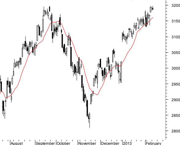
NASDAQ (3,190.73, 3,196.92, 3,184.84, 3,186.49, -5.51001)