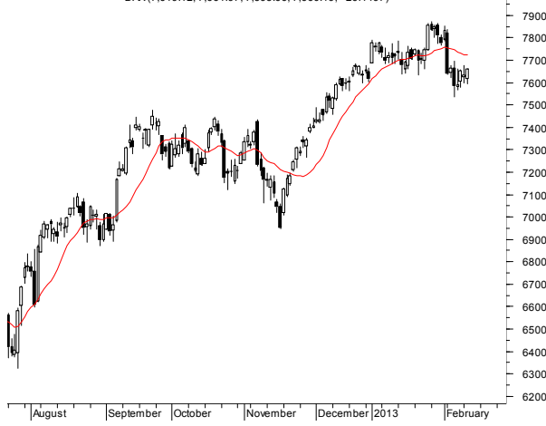
DAX (7,619.12, 7,661.97, 7,593.66, 7,660.19, +26.4497)