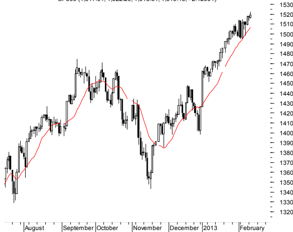
SP500 (1,517.01, 1,522.29, 1,515.61, 1,519.43, +2.42004)