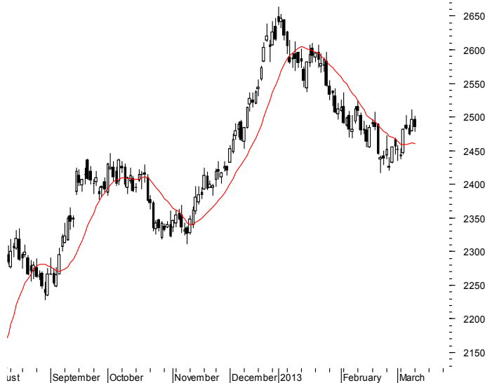
FW20 (2,497.00, 2,501.00, 2,479.00, 2,485.00, -12.0000)

Najbliższe poziomy wsparcia: 2450 2417 2400 2330