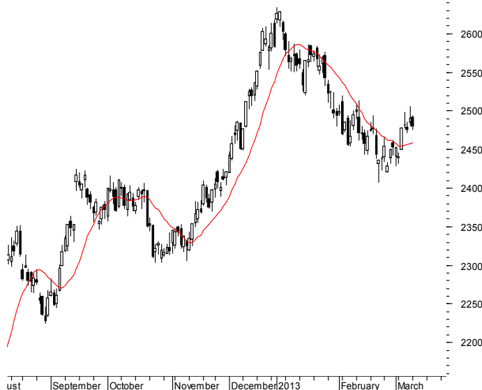
WIG20 (2,491.79, 2,494.14, 2,476.03, 2,479.20, -11.5000)