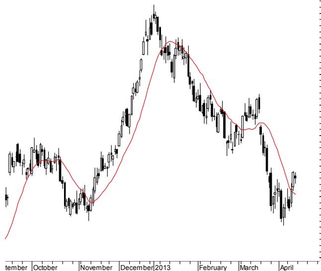
WIG20 (2,403.47, 2,406.11, 2,386.89, 2,397.08, -11.9399)