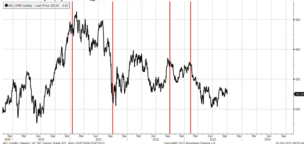
Notowania miedzi [USd/lb] w okresach „golden week” w Chinach

Tygodniowe święta w Chinach (Nowy Rok w styczniu/lutym, Święto Narodowe w październiku) w ostatnich 3 latach często stanowiły swoisty punkt zwrotny na rynku miedzi.