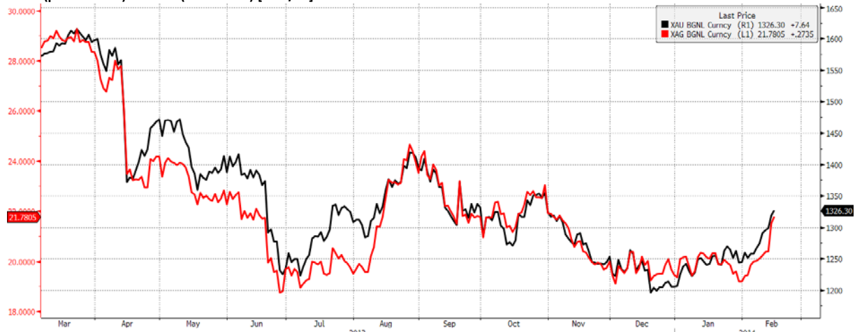
Złoto (prawa skala) i srebro (lewa skala) [USD/oz]

Notowania metali szlachetnych obroniły czerwcowe dołki i obecnie należą do najlepiej zachowujących się surowców.