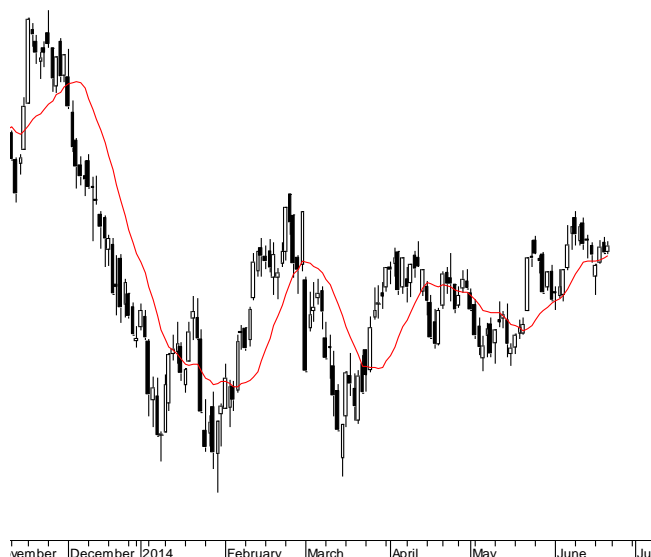
WIG20 (2,466.57, 2,471.33, 2,458.36, 2,462.13, -0.23022)