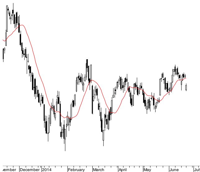
WIG20 (2,464.25, 2,478.84, 2,460.12, 2,475.89, +13.7600)