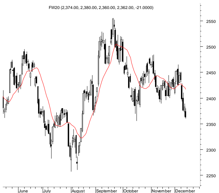
WIG20 (2,379.51, 2,380.26, 2,360.00, 2,360.00, -19.6001)