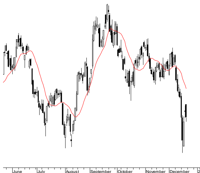
WIG20 (2,332.84, 2,333.42, 2,299.26, 2,310.88, -19.9502)