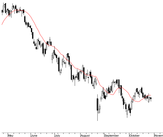
FW20 (2,110.00, 2,110.00, 2,092.00, 2,103.00, -7.00000)