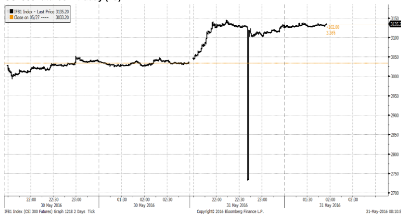
CSI 300 futures intraday (2d)