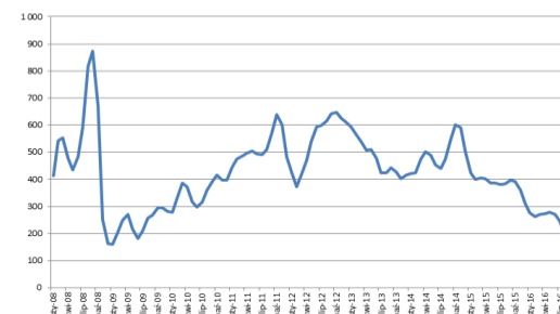
Amoniak FOB Yuzhnyy [USD/t]

W sierpniu amoniak najtańszy od ponad 7 lat.