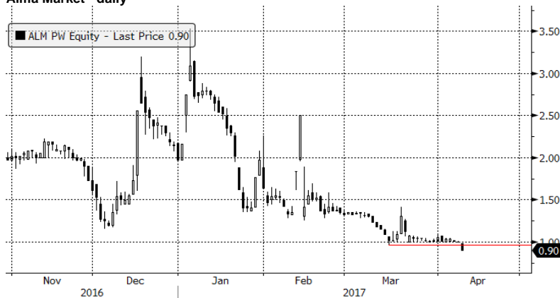
ALM PW Equity (Alma Market SA) Graph 1445 Daily 11OCT2016-11APR2017 11-Apr-2017 07:54:22