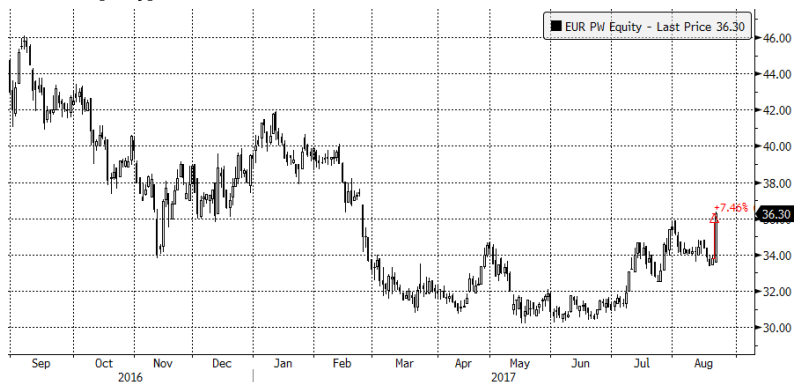
EUR PW Equity (Eurocash SA) Graph 1556 Daily 23AUG2016-23AUG2017 Copyright © 2017 Bloomberg Finance L.P. 23-Aug-2017 08:17:07

Źródło: Bloomberg, Dom Maklerski BDM S.A.