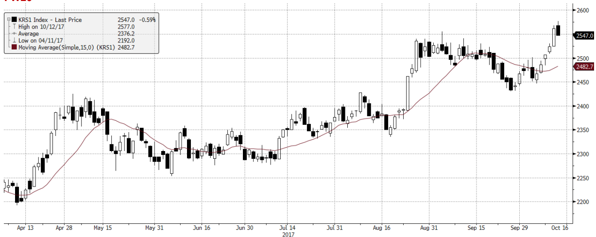
KRS1 Index (NSE WIG20 Index Future) graph 1550 Daily 06APR2017-13OCT2017 13-Oct-2017 07:45:59