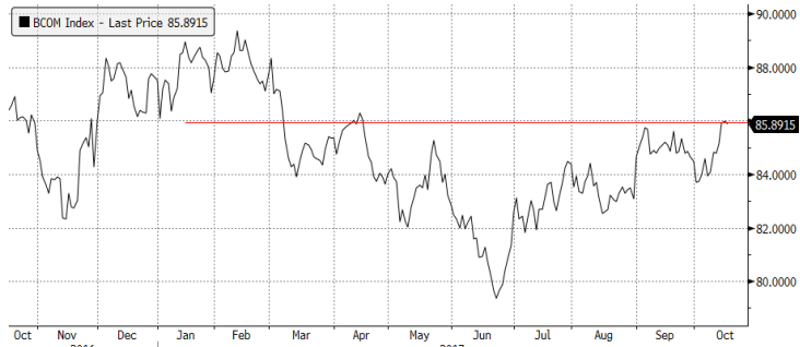
BCOM Index (Bloomberg Commodity Index) Graph 1610 Daily 17OCT2016-17OCT2017 17-Oct-2017 07:40:49