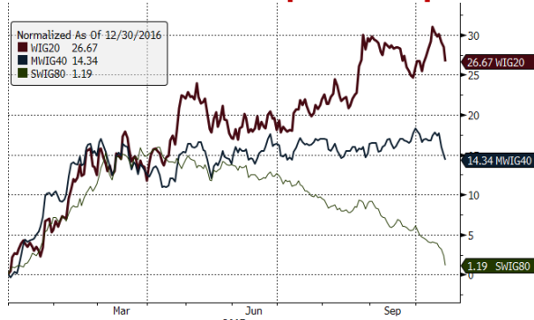
WIG20 Index (WIG20) g1111 Daily 30DEC2016-20OCT2017 20-Oct-2017 07:48:25