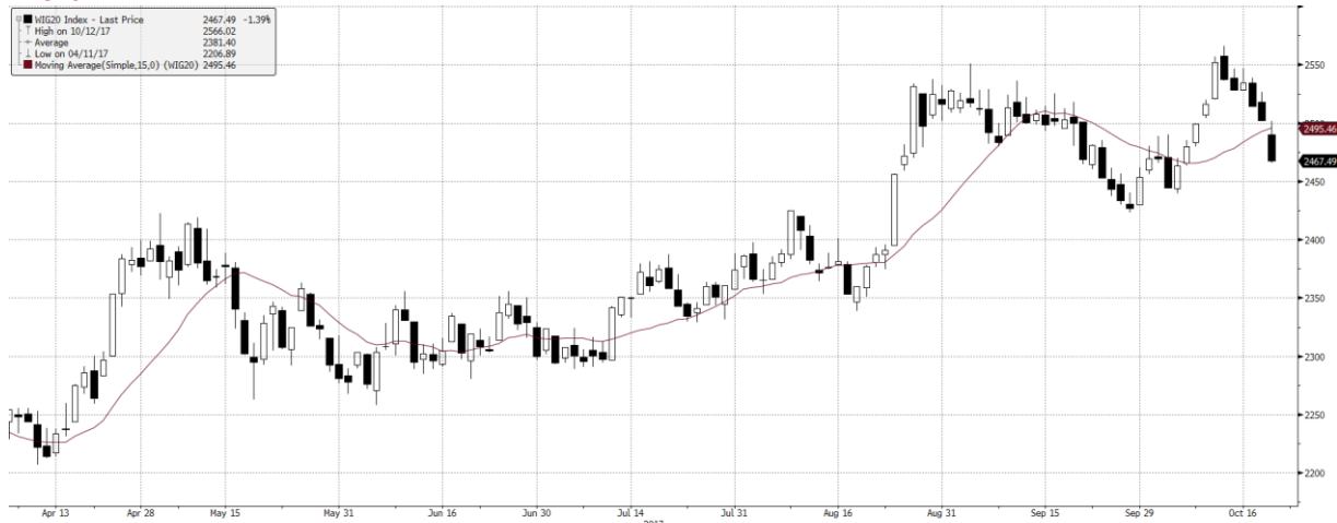
WIG20 Index (WIG20) G1988 Daily 06APR2017-20OCT2017 Copyright © 2017 Bloomberg Finance L.P. 20-Oct-2017 07:49:27 Źródło: Bloomberg, Dom Maklerski BDM S.A.