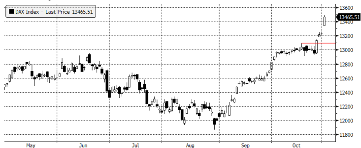
DAX Index (Deutsche Boerse AG German Stock Index DAX) Graph 1620 Daily 02MAY201 Copyright© 2017 Bloomberg Finance L.P. 02-Nov-2017 08:29:33

Źródło: Bloomberg, Dom Maklerski BDM S.A.