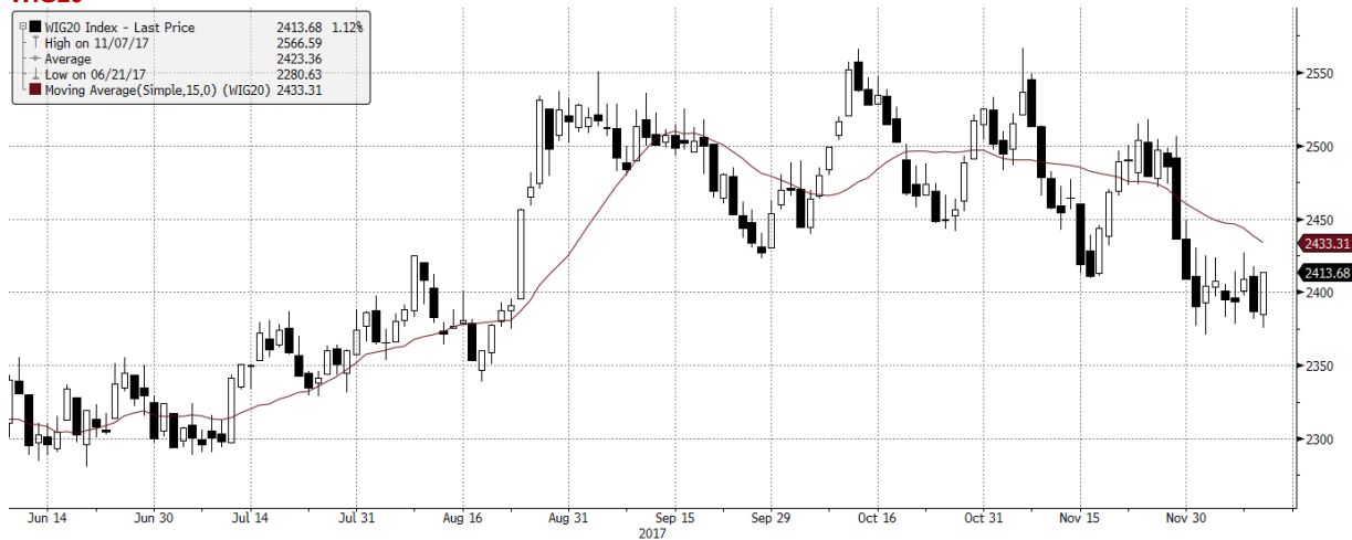
WIG20 Index (WIG20) G1599 Daily 08JUN2017-13DEC2017