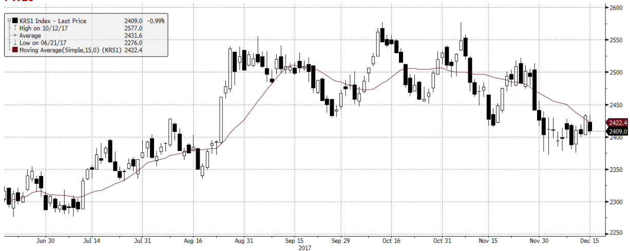
KRS1 Index (WSE WIG20 Index Future) graph 1550 Daily 18JUN2017-18DEC2017