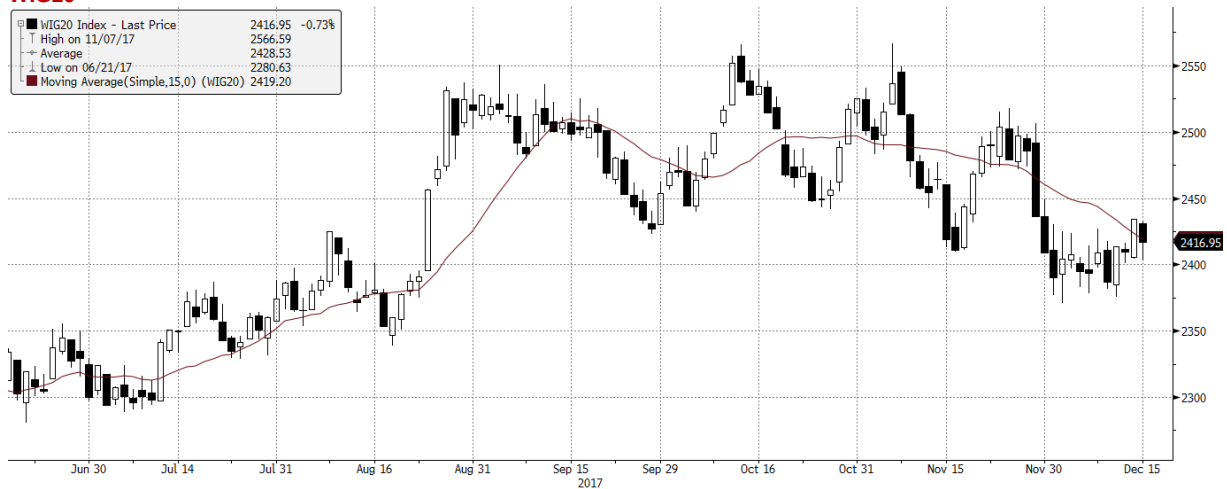
WIG20 Index (WIG20) G1599 Daily 18JUN2017-18DEC2017