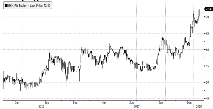
BKM PW Equity (Polski Bank Komorek Macierzystych SA) Graph 1661 Daily 01JAN2015 Copyright © 2018 Bloomberg Finance L.P. 18-Jan-2018 17:13:31