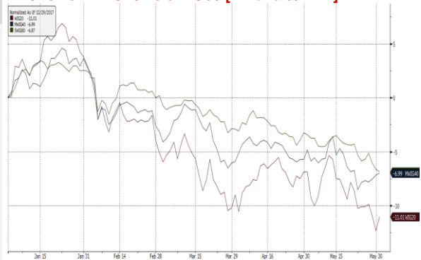
WIG20 Index (WIG20) G1511 Daily 30NOV2017-04JUN2018 04-Jun-2018 06:59:20