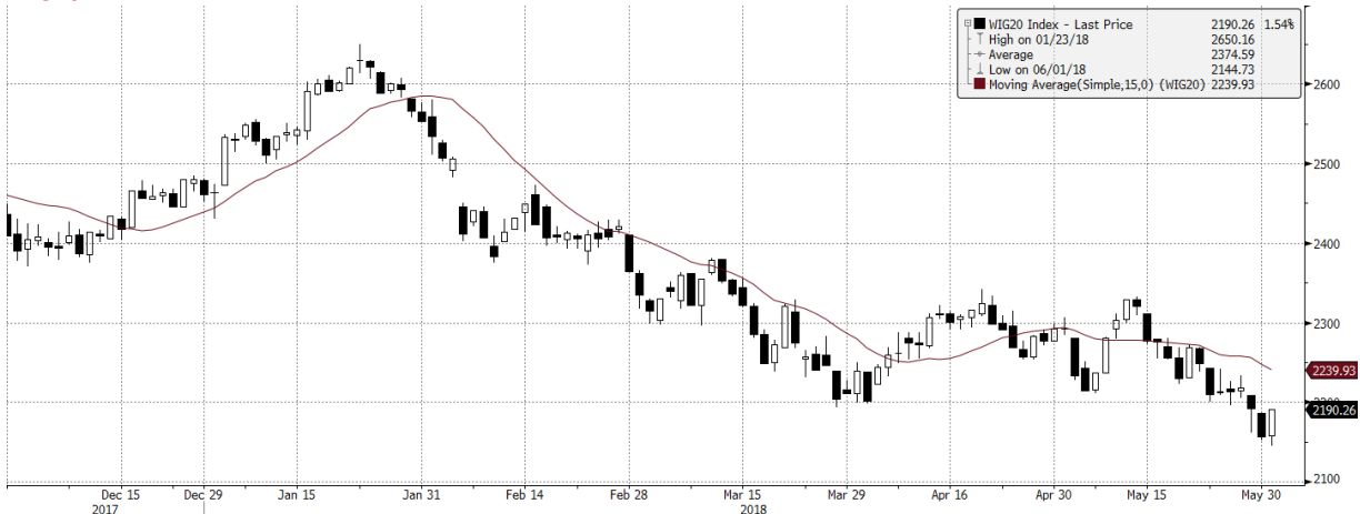
WIG20 Index (WIG20) G1598 Daily 30NOV2017-04JUN2018 Copyright© 2018 Bloomberg Finance L.P. 04-Jun-2018 06:59:43 Źródło: Bloomberg, Dom Maklerski BDM S.A.