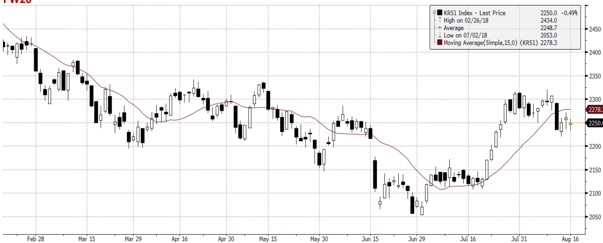
KRS1 Index (WSE WIG20 Index Future) graph 1550 Daily 17FEB2018-17AUG2018 Copyright© 2018 Bloomberg Finance L.P. 17-Aug-2018 07:48:37