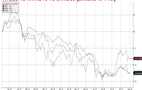
WIG20 Index (WIG20) G1598 Daily 29FEB2018-17AUG2018 Copyright© 2018 Bloomberg Finance L.P. 17-Aug-2018 07:48:14