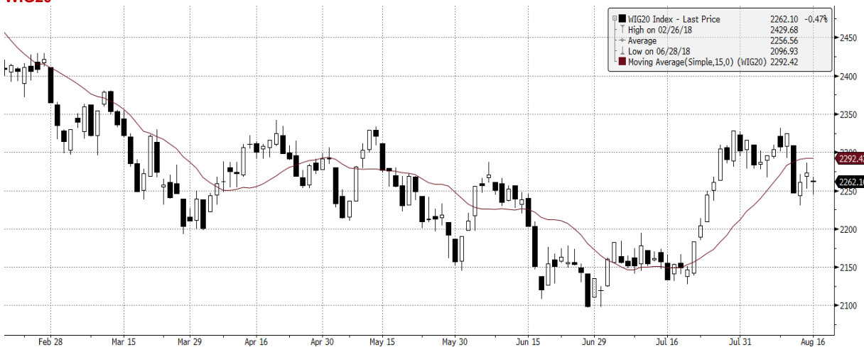
WIG20 Index (WIG20) G1598 Daily 17FEB2018-17AUG2018 17-Aug-2018 07:48:54