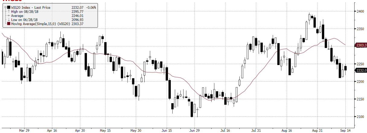
WIG20 Index (WIG20) G1598. Daily 17MAR2018-17SEP2018