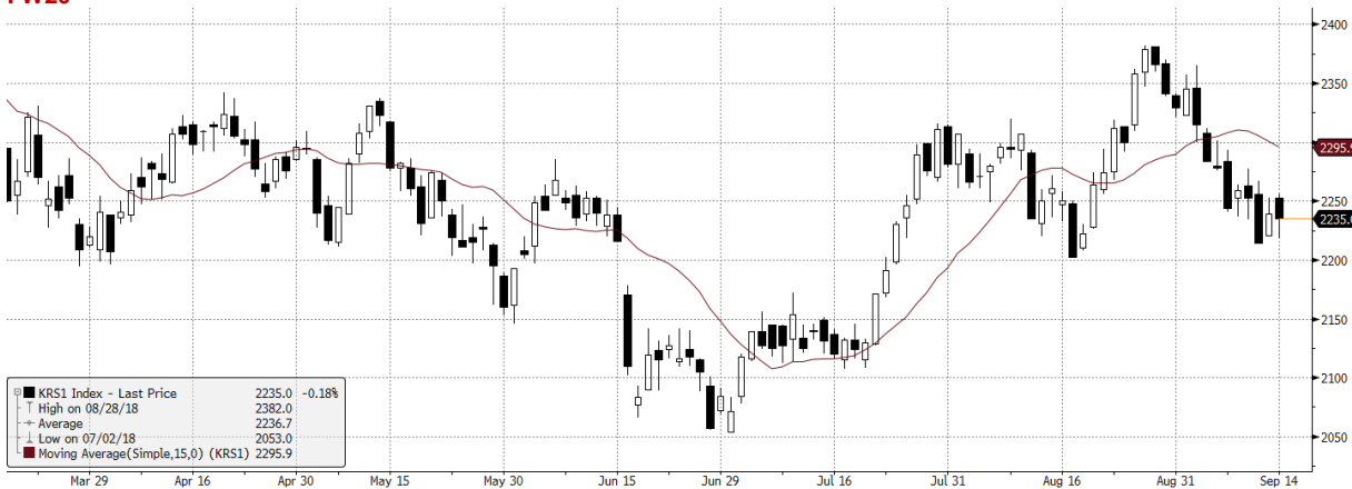
KRS1 Index (VSE WIG20 Index Future) graph 1550. Daily 17MAR2018-17SEP2018