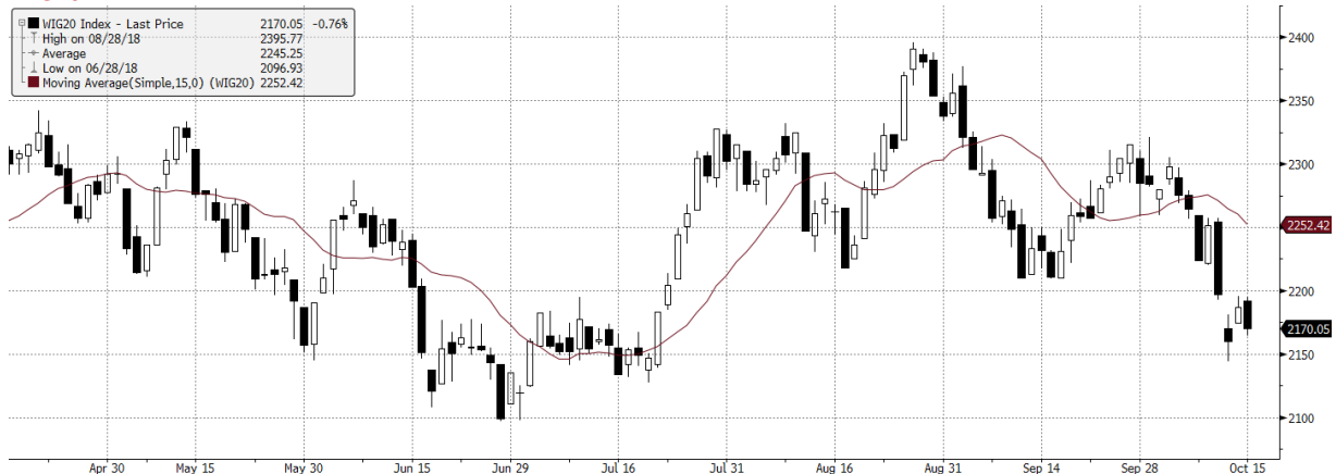
WIG20 Index (WIG20) G1598 Daily 16APR2018-16OCT2018