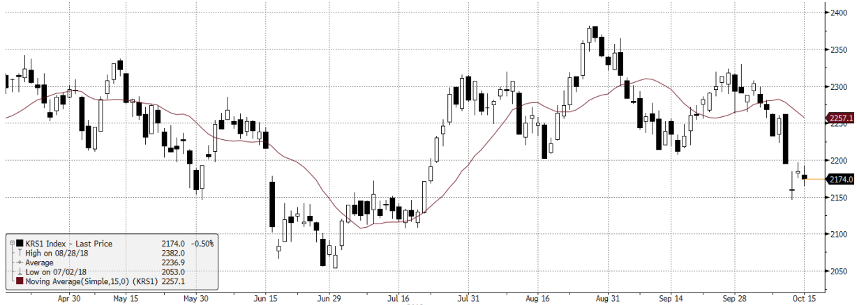
KRS1 Index (WSE WIG20 Index Future) graph 1550 Daily 16APR2018-16OCT2018 Źródło: Bloomberg, Dom Maklerski BDM S.A.