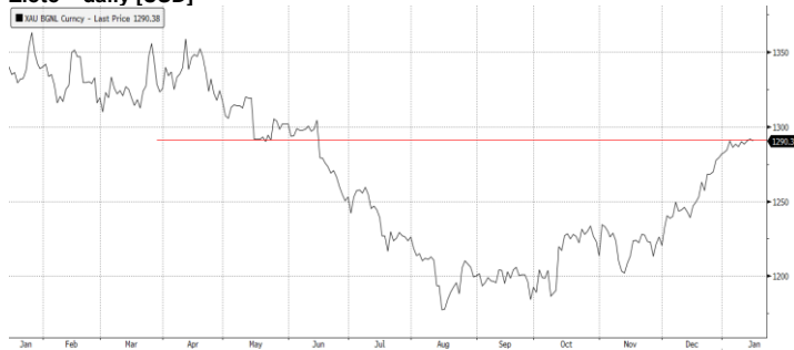
WU Currency (Gold Spot - $/OZ) Graph 18E2 Daily 15342018-15342019 Copyright © 2019 Bloomberg Finance L.P. 15-Jan-2019 07:46:15

Źródło: Dom Maklerski BDM S.A., Bloomberg