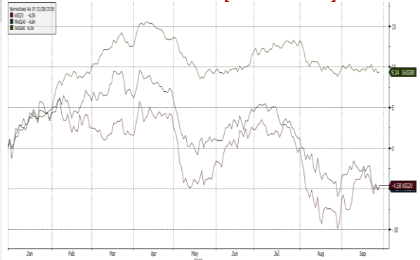
WIG20 Index (WIG20) G1111 Daily 27MAR2019-27SEP2019 Copyright© 2019 Bloomberg Finance L.P. 27-Sep-2019 07:40:59

Źródło: Bloomberg, Dom Maklerski BDM S.A.