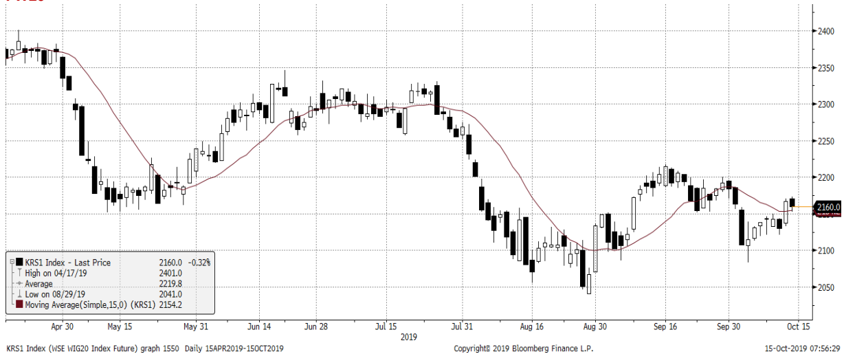
KRS1 Index (WSE WIG20 Index Future) graph 1550 Daily 15APR2019-15OCT2019