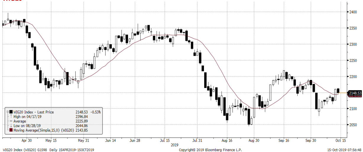
WIG20 Index (WIG20) G1598 Daily 15APR2019-15OCT2019