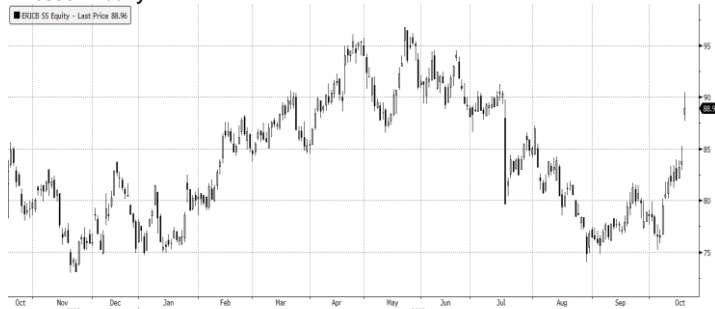
ERICSS SS Equity (NASDAQ:ERICSS) Graph 1972 Daily 18Oct2018-18