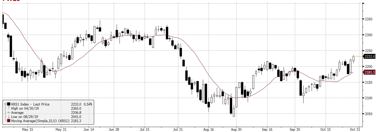
KRS1 Index (WSE WIG20 Index Future) graph 1550 Daily 30APR2019-30OCT2019