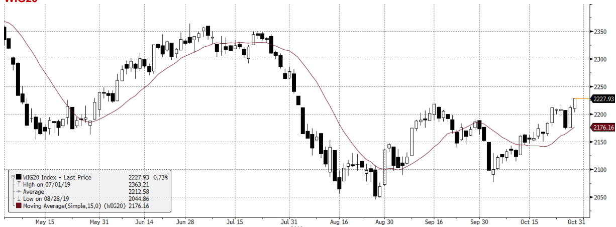
WIG20 Index (WIG20) G1598 Daily 30APR2019-30OCT2019