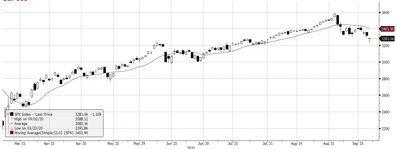
SPX Index (S&P 500 Index) G1598 Daily 22MAR2020-22SEP2020