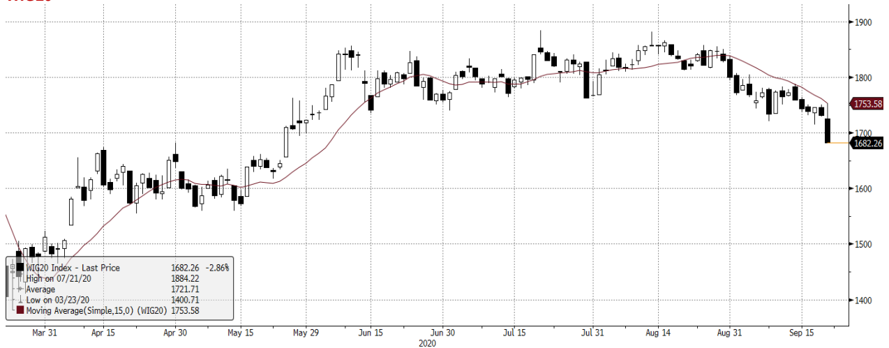
WIG20 Index (WIG20) graph 1550 Daily 22MAR2020-22SEP2020