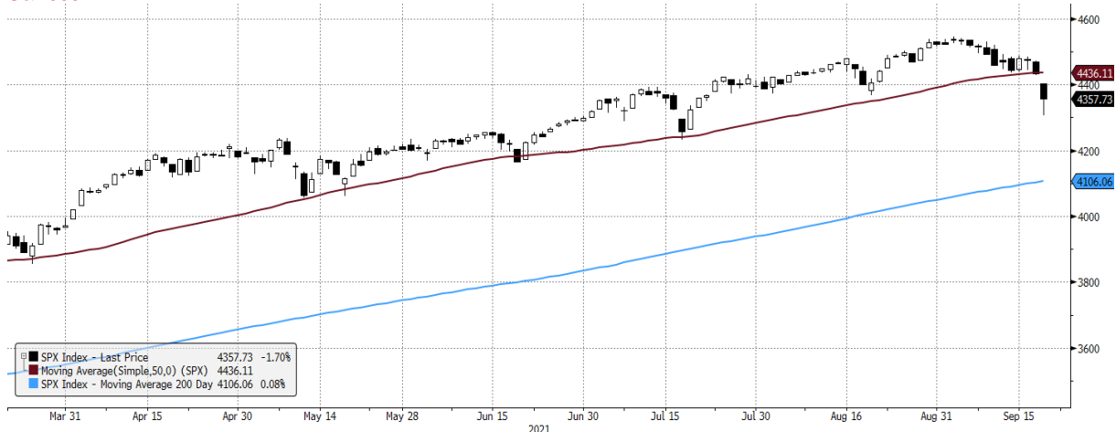
SPX Index (S&P 500 INDEX) G1598 Daily 21MAR2021-21SEP2021