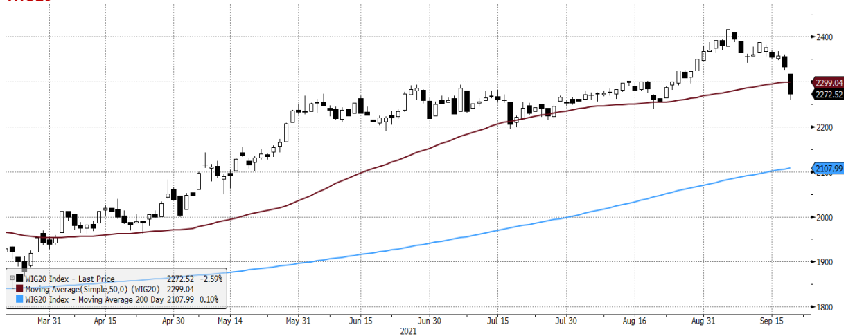
WIG20 Index (WIG20) graph 1550 Daily 21MAR2021-21SEP2021